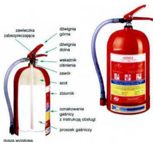
Budowa gaśnicy proszkowej (z ładunkiem CO 2 )